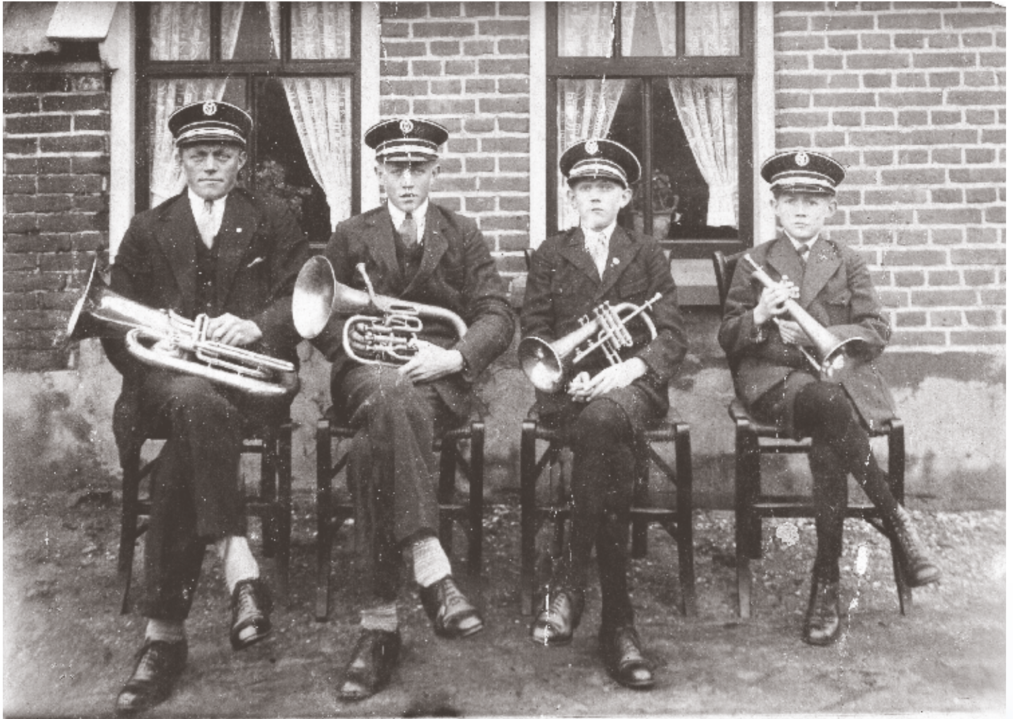
Familie Leemhuis en Berenst