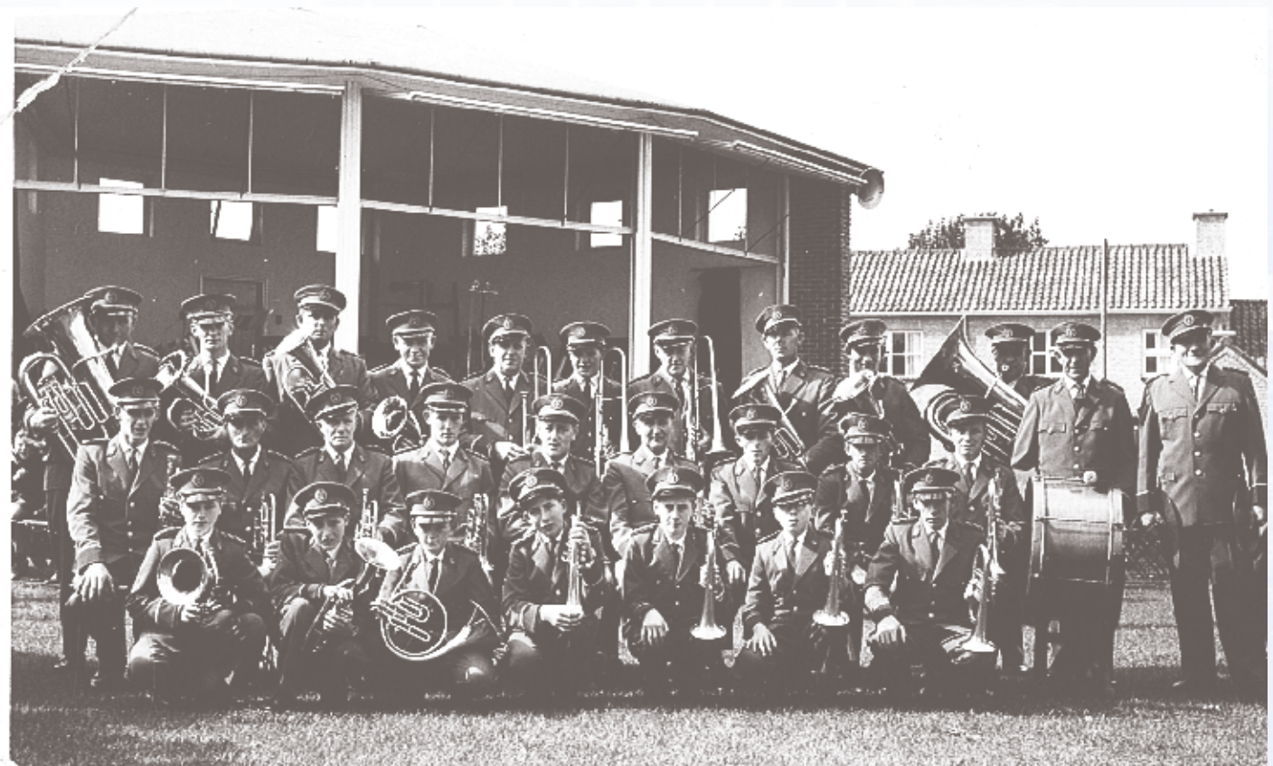
Fanfare voor de koepel