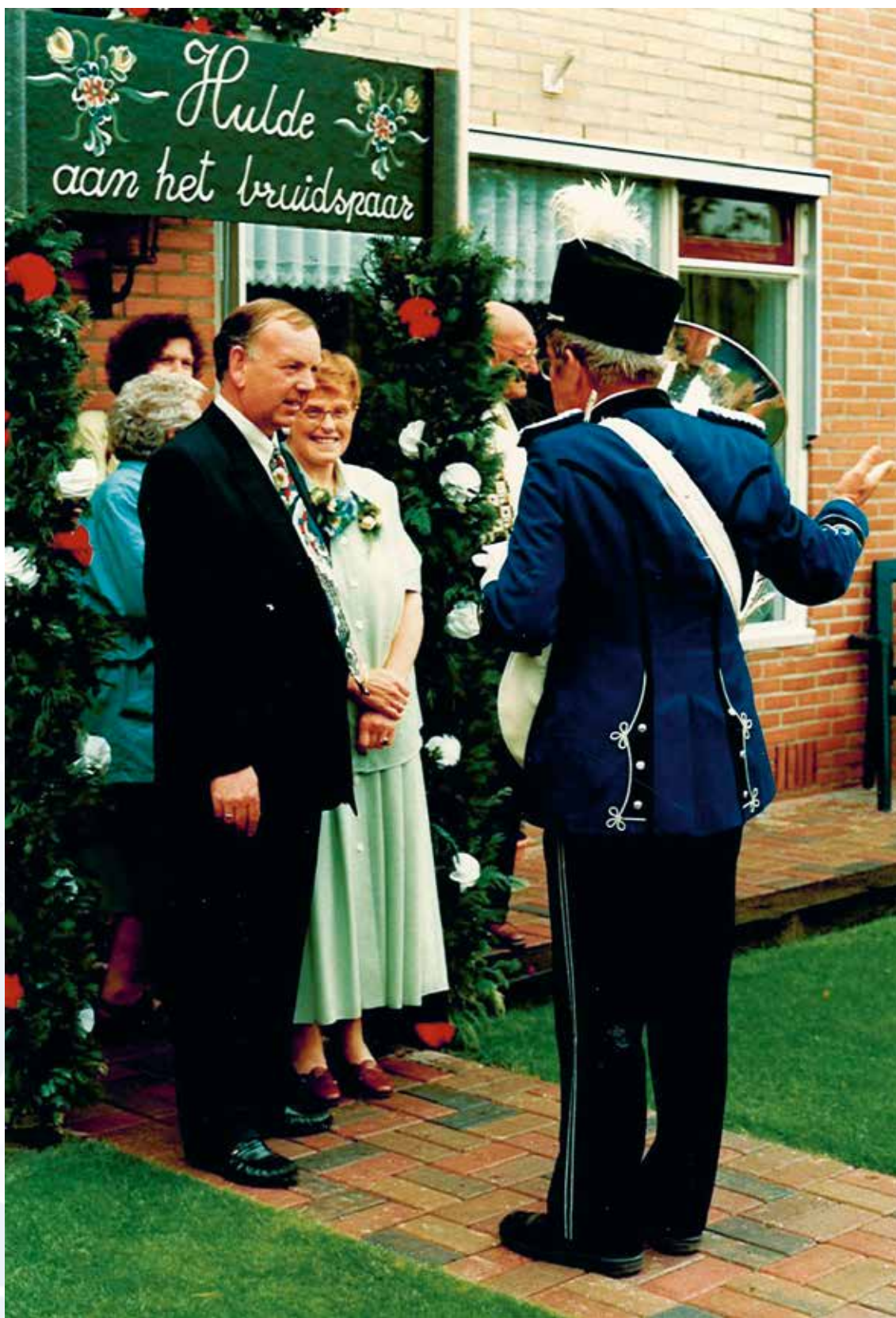
Het echtpaar Snoeyink krijgt een musicale hulde.