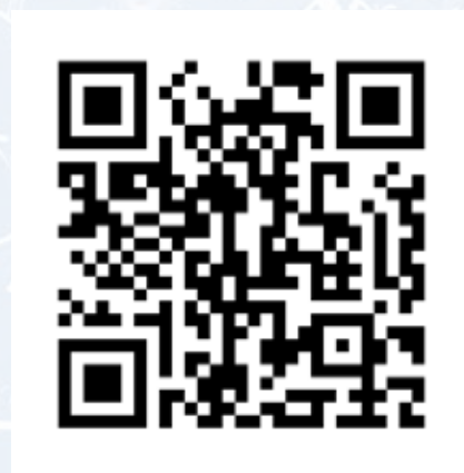
Lyrakorps en Fanfare taptoe Bergentheim (1981)